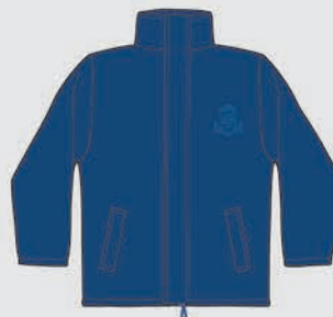
Campera reversible [de uso opcional]