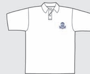
Remera Polo Clases de Educación Física