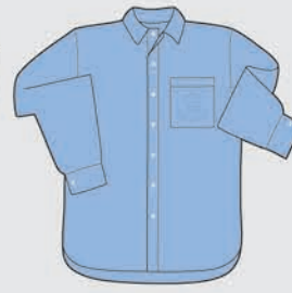
Camisa manga larga Verano / invierno